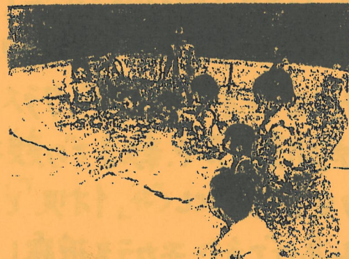
夏ならではのあそびを思いっきり楽しむことができました。

テラス横の部屋にて着替えと体操をし、たんぽぽ組、すみれ組、よつば組が時間交代で入ります。プールに入るなりみんなとってもうれしそう。ワニ泳ぎや顔つけ、パタ足対決、色取りゲームなど、「楽しい!」「やってみたい!」とそれぞれのペースで友達と一緒に過ごしています。そして途中休憩はテラスのベンチに座ってほっこりタイム。いい場所なんです。