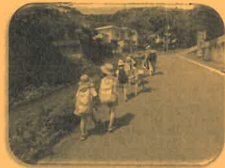
暑かったけれど、みんなで励ましあいながら、小倉神社を目指しました。