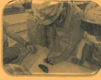
自分たちの育てた夏野菜を収穫し、カレーに入れました。