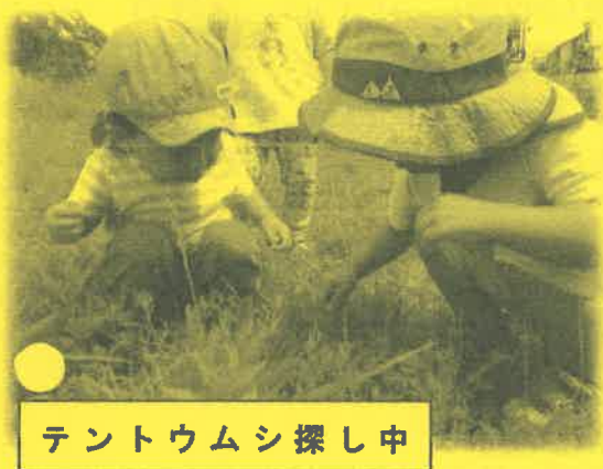
テントウムシ探し中

4月は園周辺のお散歩が多く、特に川沿い（芝生公園）へ遊びに行くことが多かったおひさま組さん。川沿いにはタンポポや綿毛、チョウチョウ、テントウムシ、サクランボなど春の自然がたくさん！！子ども達も散歩に出掛けると分かって「テンテンちゃん探しにいこう」「タンポポあるかな？」という声も。いざ川沿いへ行くと「あっテンテンちゃんいた」「えっどこどこ？」と虫探しがスタート！夢中になってあっちこっちと探し回る子ども達です。最近ではどの辺りにいるかも分かってきて「このへんにいるんじゃない？」「まえここにいたで」と教えてくれる子も！また「タンポポいっぱいだな」とタンポポを摘んだり、綿毛をフーと飛ばしてみたりと散歩を通して春の自然を発見したり触れたりととっても仲良しになりました。